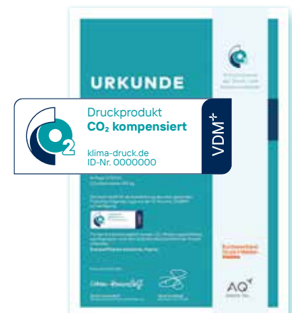
Urkunde und Logo für Druckprodukte, deren Emissionen kompensiert wurden