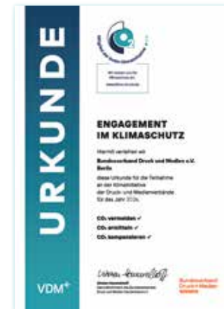
Die Urkunde bestätigt die Mitgliedschaft in der Klimainitiative.

Für jedes Produkt, dessen Emissionen ausgeglichen wurden, erhalten Kund:innen eine Urkunde als Nachweis für den Beitrag zum Umweltschutz. Mitglieder der Klimainitiative werden auf der Website klima-druck.de präsentiert. Einkäufer:innen finden hier schnell die klimafreundliche Druckerei in ihrer Nähe.